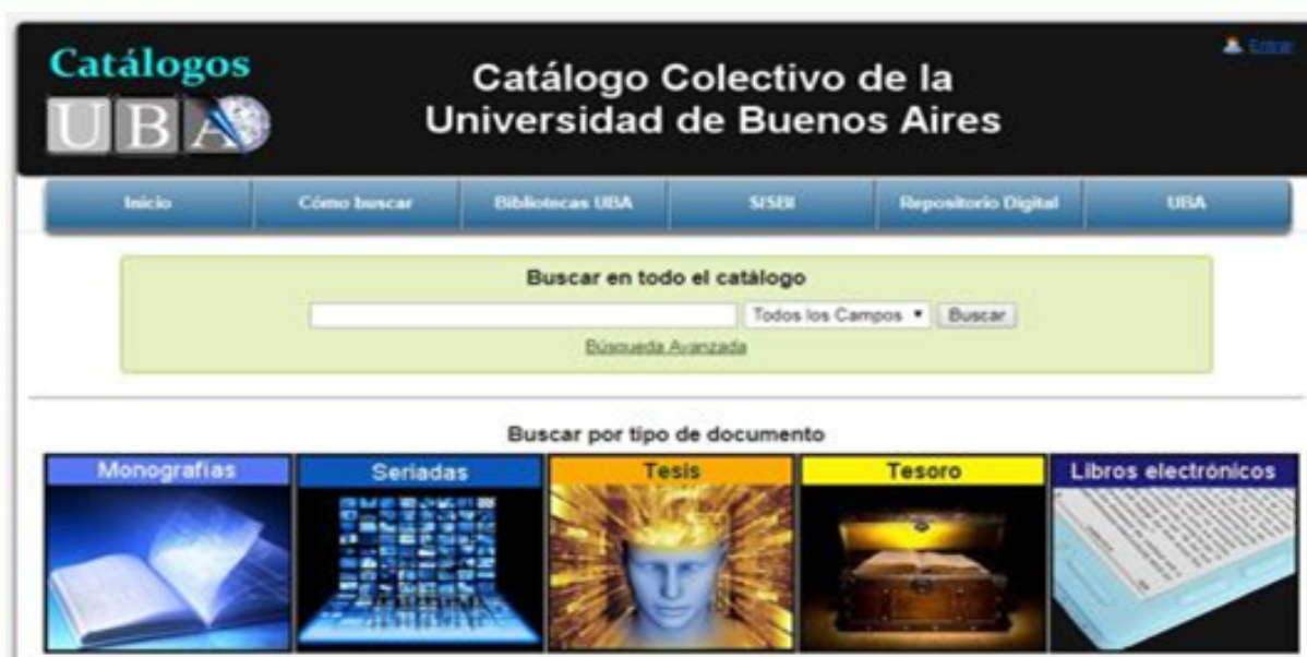
Página principal del Catálogo Colectivo