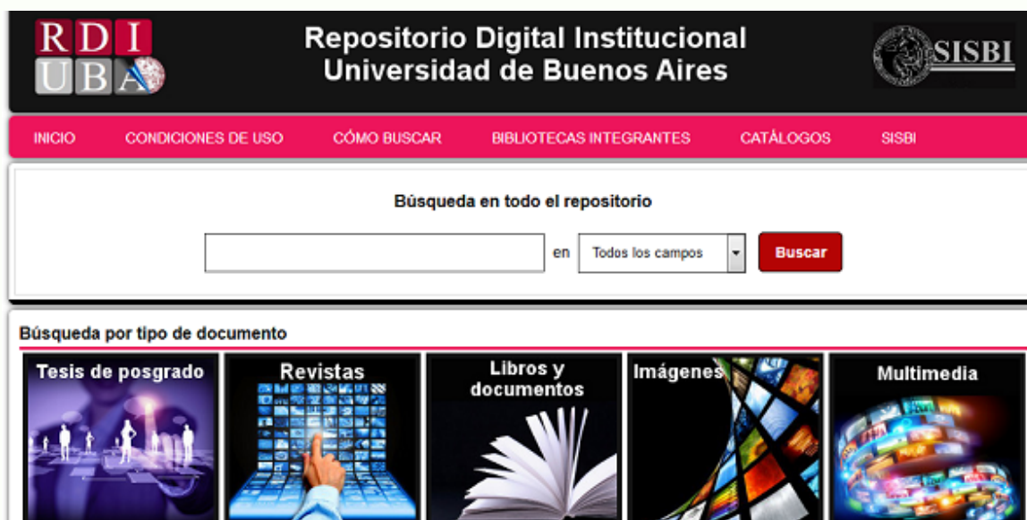
Página principal del RDI-UBA