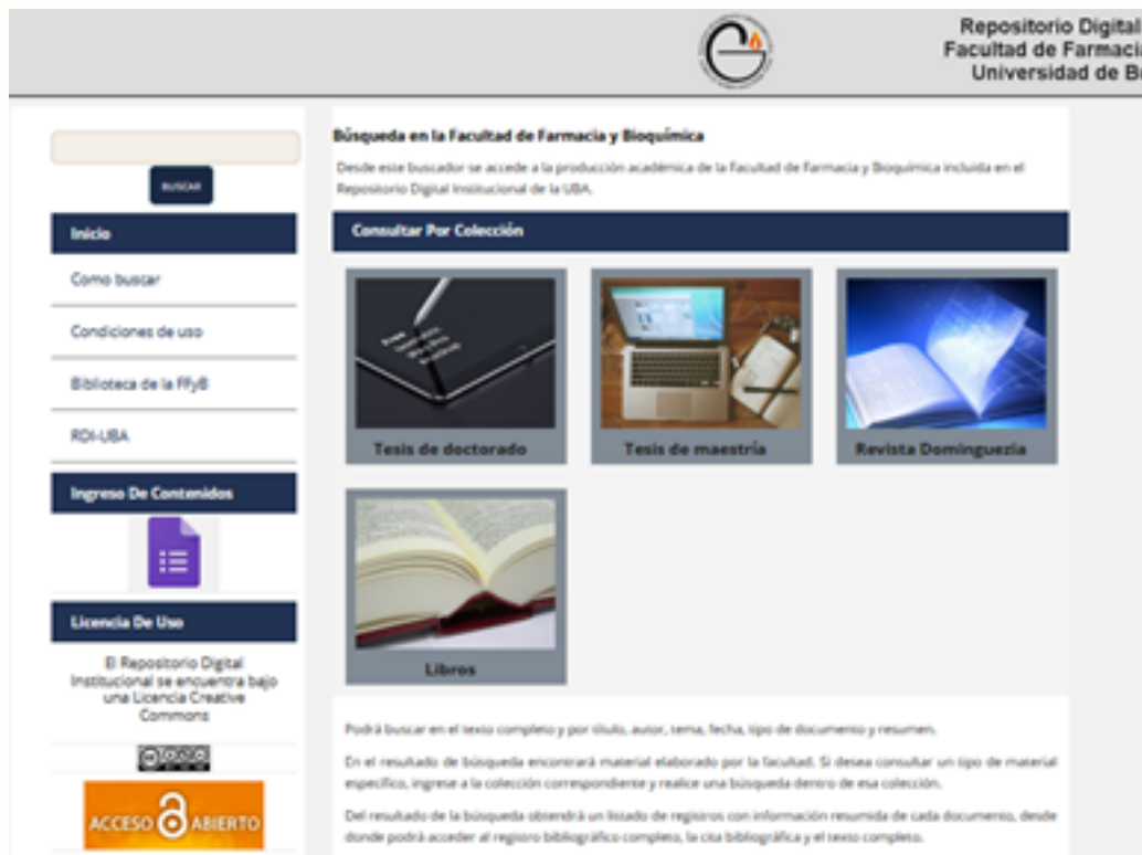
Nuevo diseño de los sitios de repositorio para las Facultades, desarrolladas en el SISBI (Greenstone 3)