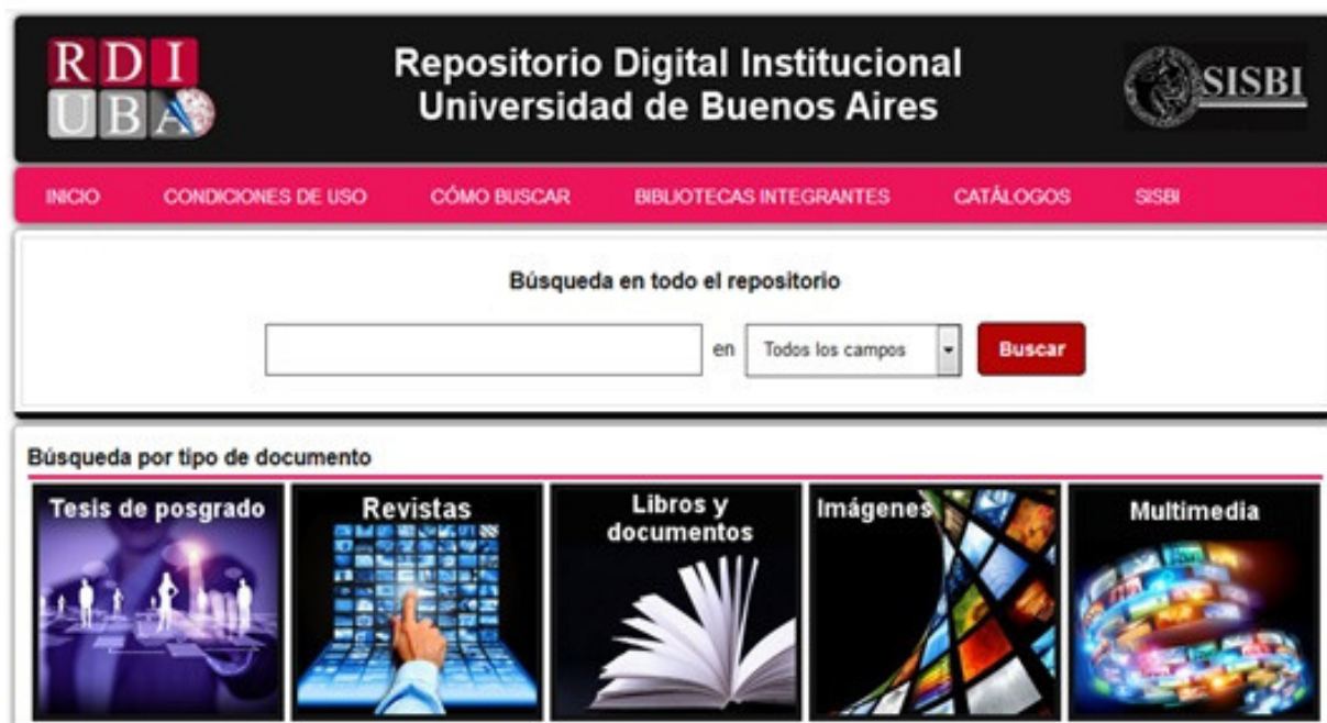
Página principal del RDI-UBA

El RDI-UBA tuvo un importante crecimiento en la cantidad de colecciones[3] y de recursos que posee y a los que brinda acceso en texto completo: